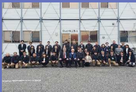
集合写真(本社にて)