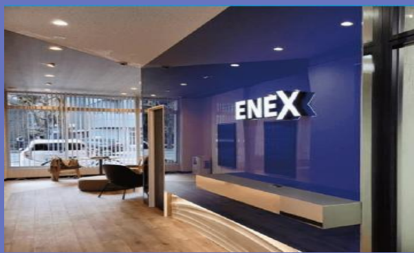
博多ショールーム