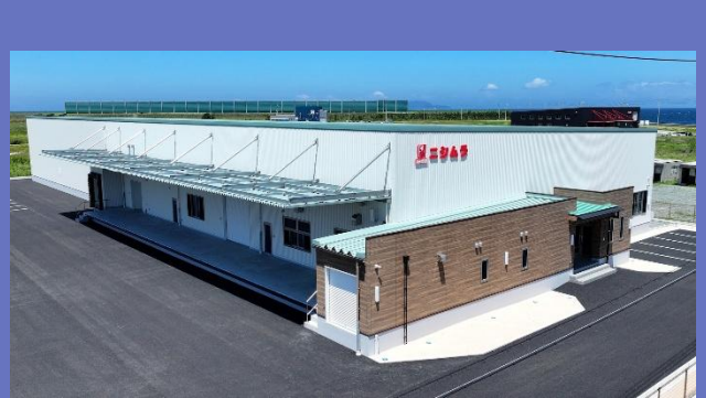
2024年開設の関門流通センター