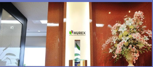
エントランスラウンジ