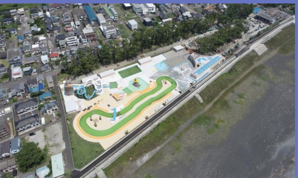
大浜公園（PFI事業 プール、公園の設計・施工・維持管理）