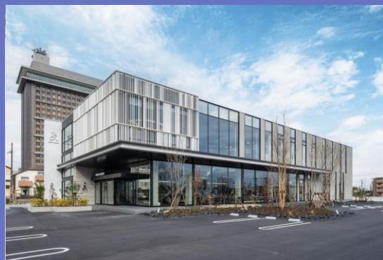
事業所 コワーキングスペース併設の新社屋

○本社所在地：岐阜県岐阜市荻田南3丁目7-20 ○事業概要：ビルメンテナンス、警備、公共施設の管理 ○常時使用する従業員数：2,375名（グループ全体2025年9月期） ○現在の売上高：55億円（グループ全体2025年3月期） ○法人番号：2200001039222 ○Web：https://www.kk-giken.jp/