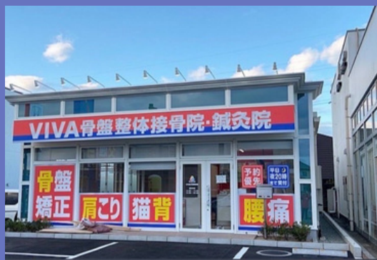
株式会社Loop Quest (ループクエスト)