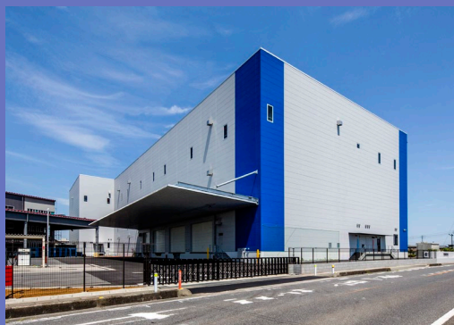
（株）エムエスジャパンの主要倉庫