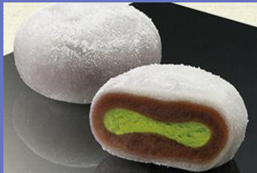
主力商品 喜久福（仙台の銘菓）