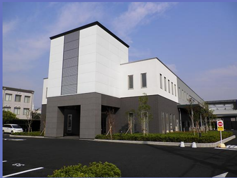
本社セレモニールーム