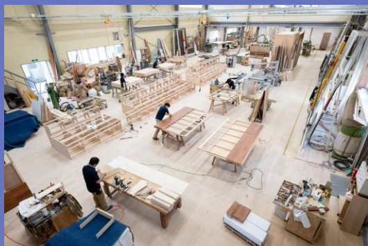
自社工場（千葉県白井市）