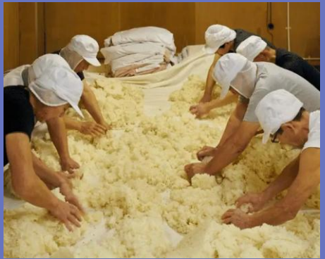
杜氏/蔵人たちによる伝統的な酒造り 酒造りの技術を継承