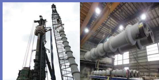
「HY-BSパイル」の施工・製造風景