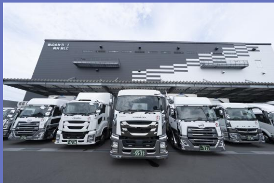
仙台にある自社物流センター