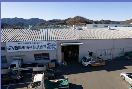
本社・八王子営業所