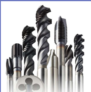
タップ・ダイス・センタ穴ドリル

○本社所在地：東京都中央区京橋 ○事業概要：精密切削工具製造 ○常時使用する従業員：650名 （2024年12月時点） ○現在の売上高：77億円 （2024年12月期） ○法人番号：6010001062727 ○Web： https://www.yamawa.com/jp/