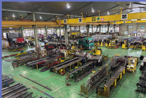
工場（鋼材加工を行っております）