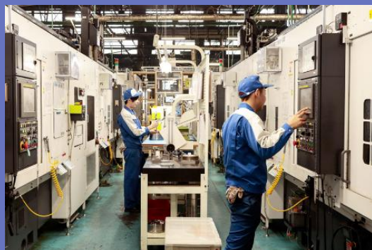
機械加工製造ライン