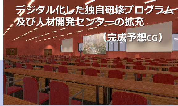
デジタル化した独自研修プログラム及び人材開発センターの拡充