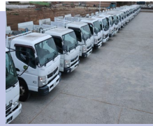
自社の車両及び運転手の育成確保