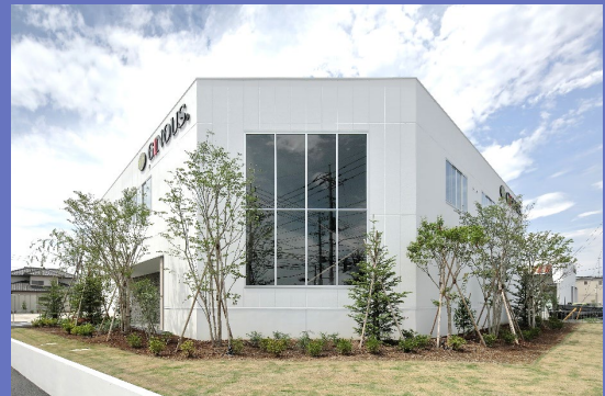
本社建屋（創業60周年新社屋竣工）