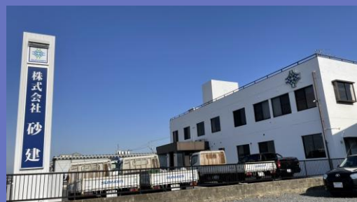
株式会社砂建 本社