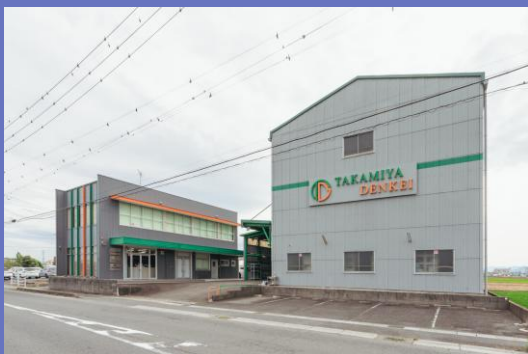
高宮グループ本社事業所