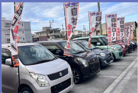
中古車販売展示場