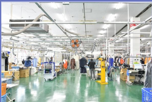
本社工場生産ライン