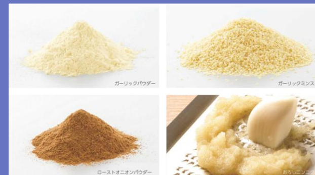
主力商品（乾燥粉末）