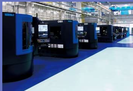
主力製品 CNC工具研削盤