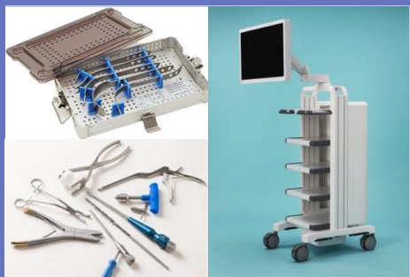
事業の3本柱 (滅菌ケース、手術器具、内視鏡カート)