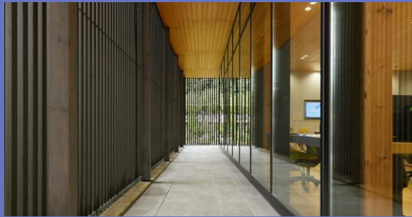
リニューアルしたオフィスデザイン