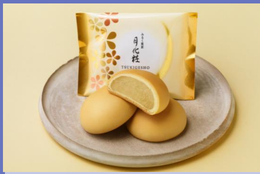
みるく饅頭 月化粧 (主力商品：自社で製餡した みるく餡を使った和洋折衷菓子)