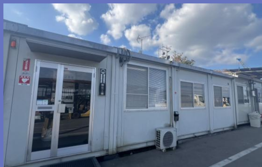
本社の外観 福岡市