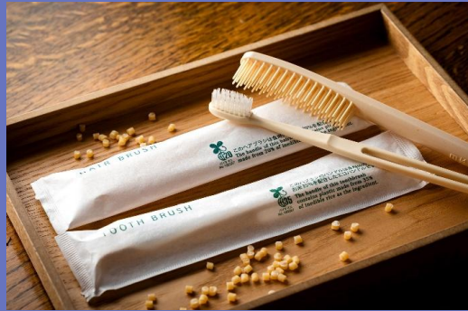
バイオマアメニティ商品のイメージ