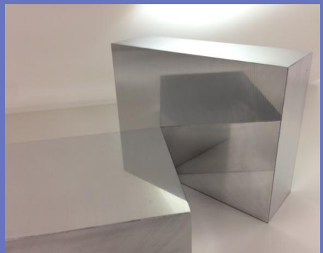
アルミニウム合金切断品

○本社所在地：大阪府大阪市北区天神橋 5-8-3 ○事業概要：非鉄金属材料販売・加工 ○常時使用する従業員：110名 （2025年9月時点） ○現在の売上高：70億円 （2025年9月期） ○法人番号：9120001061541 ○Web：https://www.okouchi.co.jp