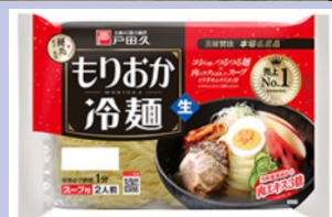
本社（上）と 主力商品・もりおか冷麺（下）