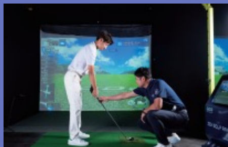
インドアでプロのレッスンを提供