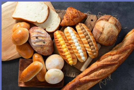
主力商品：製パン・製菓用フィリング