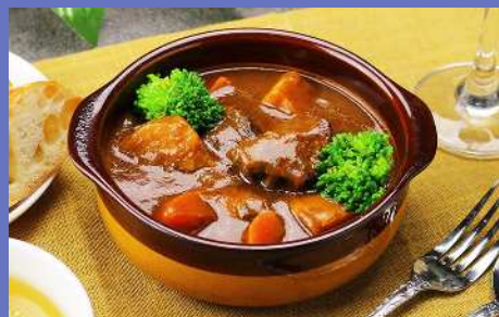
当社製品例（デミグラスソース）