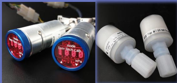
HYPZ6801シリーズとSE3201シリーズ