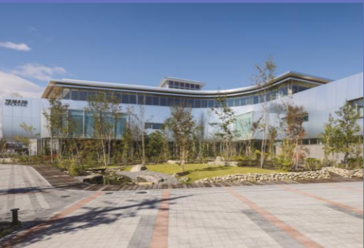
ヤマニパッケージ 本社

○本社所在地：岐阜県岐阜市 ○事業概要：包装資材の製造販売 ○常時使用する従業員：186名 （2025年12月時点） ○現在の売上高：68億円 （2024年12月期） ○法人番号：2200001005645 ○Web： https://yamani-p.com/