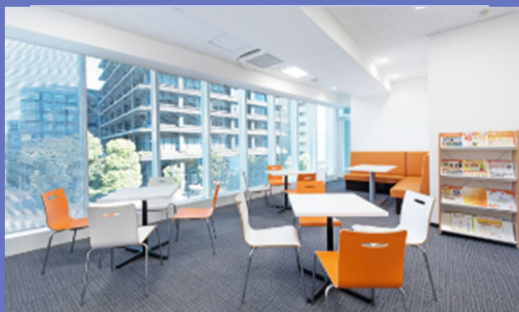
レンタルオフィス「アントレサロン」

○本社所在地：神奈川県横浜市西区 ○事業概要：起業支援サービス ○常時使用する従業員：20名 （2026年1月時点） ○現在の売上高：14億円 （2025年3月期） ○法人番号：7010001119179 ○Web：https://ginzasecondlife.co.jp/