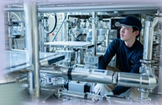
工事・メンテ部門