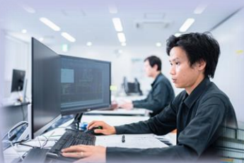
設計・エンジ部門