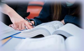
バリデーション部門