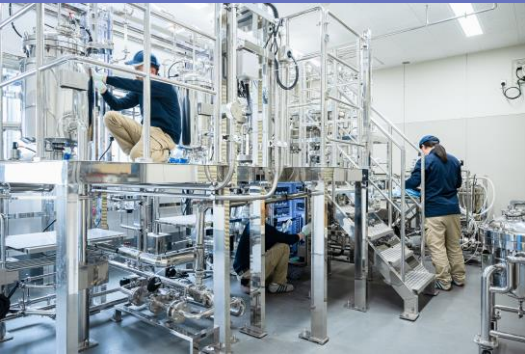
当社主力製品（医薬品製造に係る調製装置）