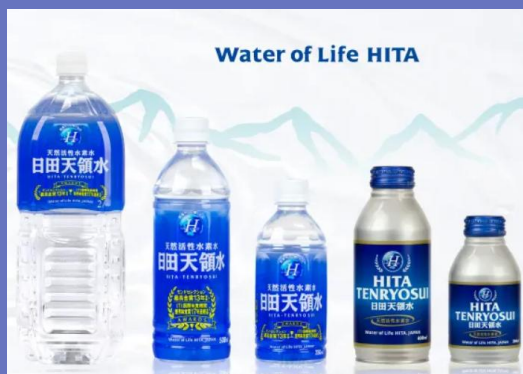
主力商品 日田天領水