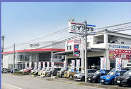
ISGホールディングス 本社