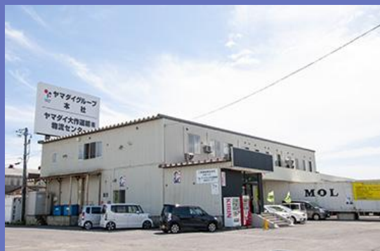
株式会社ヤマダイグループ 本社