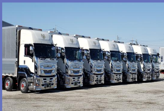
当社保有車両（トラスト営業所）