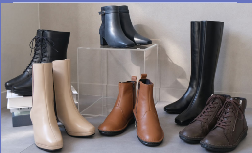
ポインターシューズ製造商品