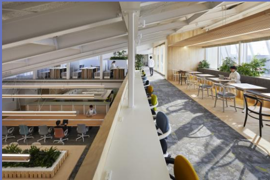
小柳建設オフィス