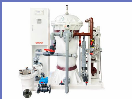
主力商品：ろ過装置