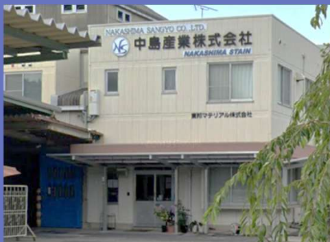
中島産業(株)：土岐工場