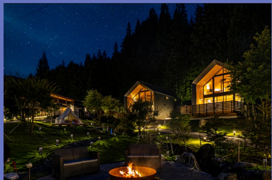
mokki（グランピング施設）