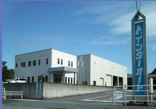
インターオート本社外観