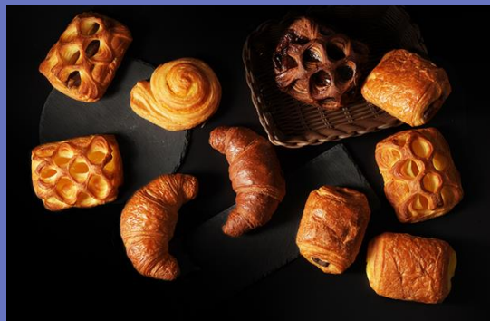
ロングライフパン